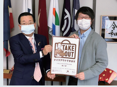
高山市長（向かって左）と一緒に

20 代の最後に、よりまちづくりに関わるための大きな挑戦を考えています。在学中から一貫して恵まれている人の縁を感じ、いつか胸を張って母校にも恩返しができるよう頑張ります。