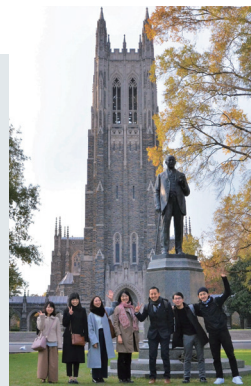
研修先のノースカロライナ州にて (筆者は右から2番目)

状況が落ち着いたら同窓生の皆さまも、ぜひ岐阜、そして柳戸へお越しください。岐阜に関わるひとりとしてお待ちしております。