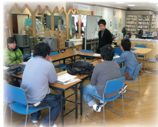
大垣市東外側 2-6 広瀬第一ビル 1階