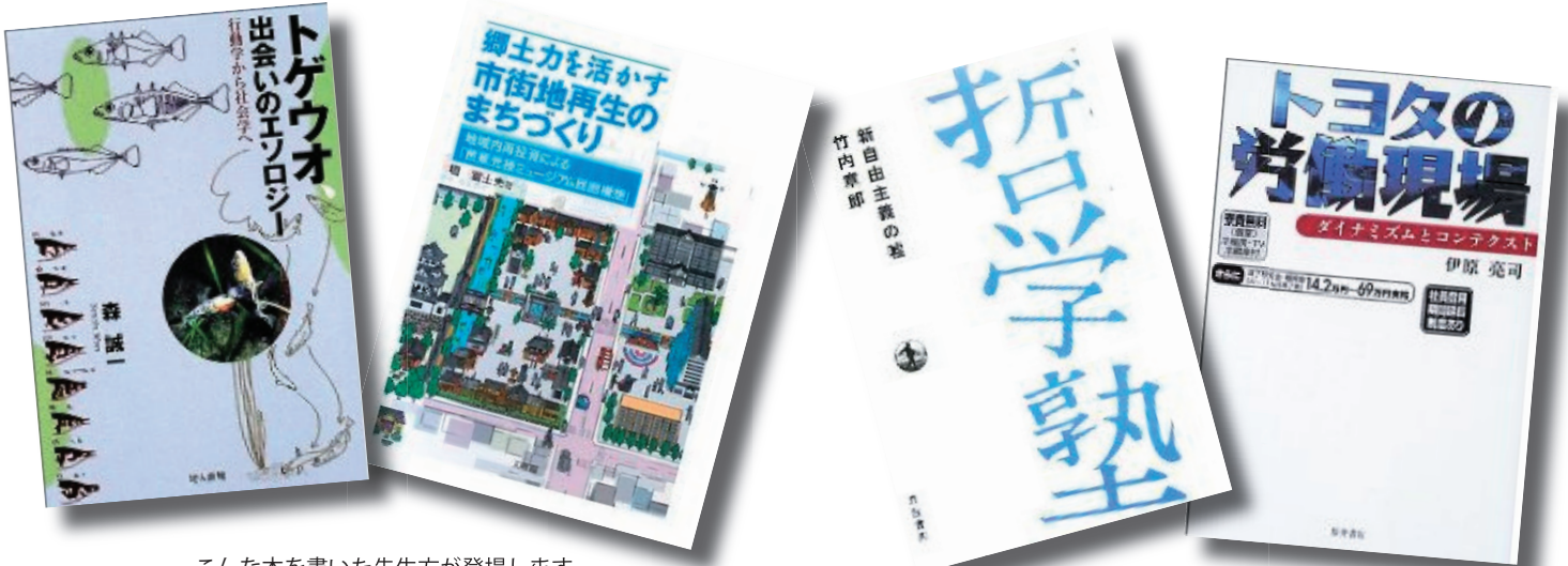
こんな本を書いた先生方が登場します